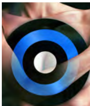
CÂNCER DE MAMA PREVINA-SE (Pagina 4)